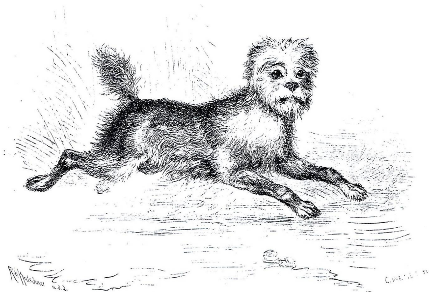
Abb. 55 Affenpinscher aus A. E. Brehm, Illustriertes Thierleben , 1864