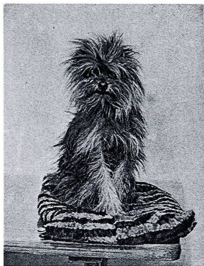
Abb. 56 Affenpinscher »Fatzke«, 1890, Eig. Max Hartenstein

Rodunomainen apinapinseri on pieni ja neliömäinen koira, jonka ulkomuoto muistuttaa griffon bruxelloisea, trimmausta lukuun ottamatta. Apinapinserillä on pyöreähkö pää, mutta ei kuitenkaan ylösvetäytynyt kuono eikä yhtä lyhyt kuin griffoneilla. Selkä on suora ja kulmaukset ovat kohtuulliset. Karva on karkea ja tiivis sekä päässä joka suuntaan sojottavaa. Apinapinserillä on alapurenta, mikä antaa apinamaisen ilmeen.