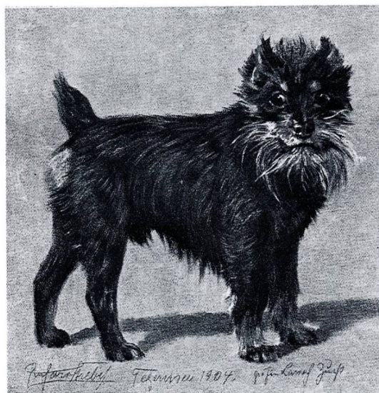
Abb. 58 Affenpinscher aus dem Jahre 1904, gezeichnet von R. Strebel